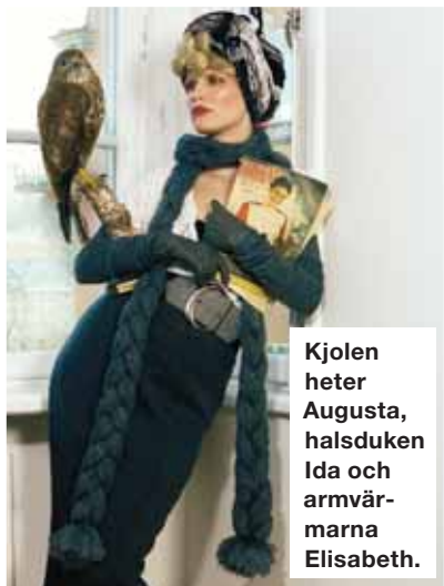
Kjolen heter Augusta, halsduken Ida och armvärmarna Elisabeth.